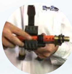
Fitting und Rohr ins Werkzeug einlegen