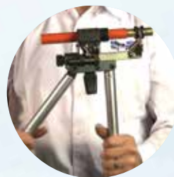
Fitting und Hülse am Rohr verbinden - in einem Schritt